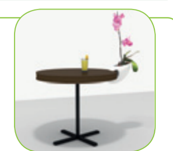
Babyfone : Roman Chauveau - Une jolie manière de créer des oasis de verdure aux terrasses des cafés.