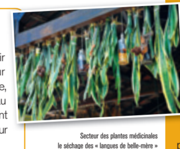
Secteur des plantes médicinales le séchage des « langues de belle-mère »

Morceaux choisis de ce road movie naturaliste : Rio de Janeiro