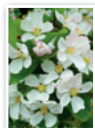
Un pommier d'ornement parrainé par l'Institut Jardiland. L'abondance et l'excellente qualité de son pollen en font un pollinisateur précieux pour les arboriculteurs et jardiniers amateurs.

L'Institut Jardiland confirme son engagement en faveur de la biodiversité en faisant don de plusieurs variétés anciennes d'arbres fruitiers - pruniers, cerisiers, pommiers, poiriers et mirabelliers - pour la création du nouveau verger de la Bourdaisière. Inauguré cet automne, chaque arbre porte le nom de la famille venue le planter ! Un acte fort et symbolique. Une initiative permettant de créer du lien entre les générations et offrant aux plus jeunes la possibilité de retrouver les saveurs et les goûts d'autrefois. Au fil des saisons, chaque propriétaire est invité à suivre l'évolution de son arbre, à en récolter et déguster ses fruits ou à offrir sa récolte à une association locale.